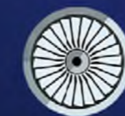
ПОТРЕБИТЕЛЬСКИЕ (НЕПИЩЕВЫЕ) ТОВАРЫ