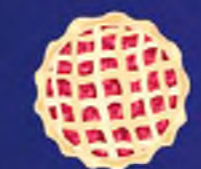
ПРОИЗВОДСТВО ПИЩЕВЫХ ПРОДУКТОВ